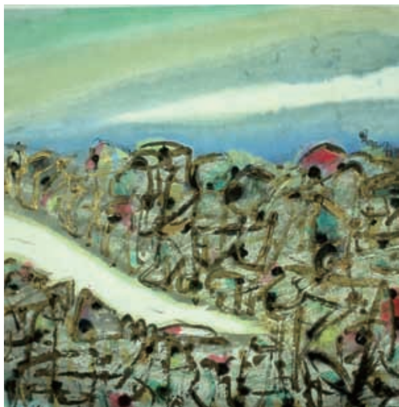
流动的城市风景之二 68cmx68cm