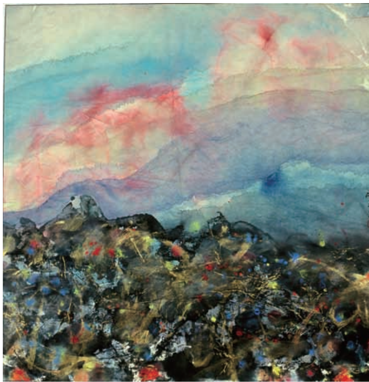
流动的城市风景之一 68cmx68cm

1983年至今，曾多次参加全国及省市各类书画展并多次获奖。作品曾先后多次被湖北武汉美术馆、中国美术馆收藏；曾先后多次在法国、美国、新加坡、韩国等国家展出并收藏；曾先后多次被《美术》、《光明日报》、《中国书画报》等报刊刊登；出版有《长江三峡神游图》长卷，《都市水墨画集》等。现就读于中国国家画院周韶华导师工作室高研班。