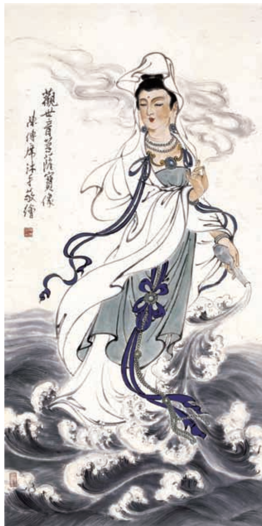
■ 国画·《观世音菩萨宝像》