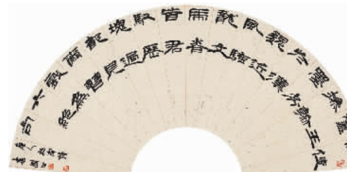
书法作品:隶书扇面