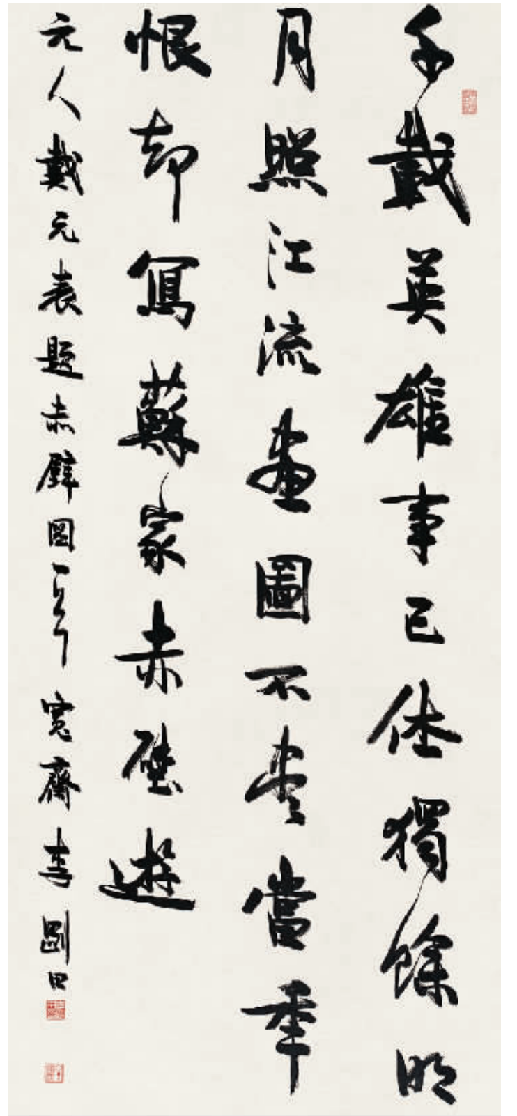
李刚田书法作品:行书中堂