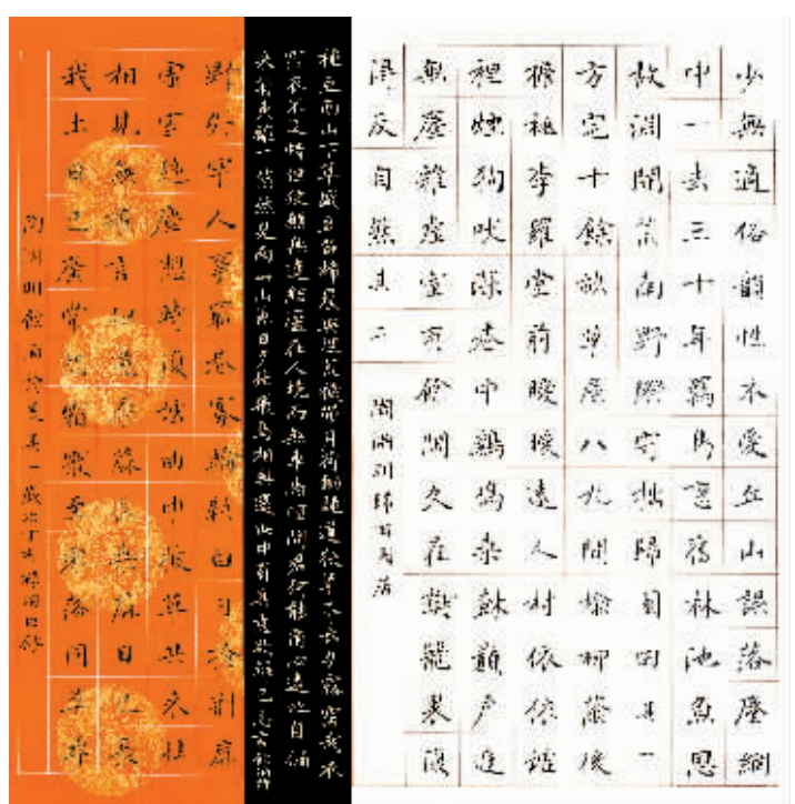
楷书陶渊明《饮酒诗》70cmx70cm 纸本 2007年(中国美术馆收藏)