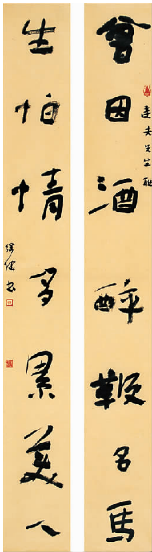
徐健作品 四尺行书对联