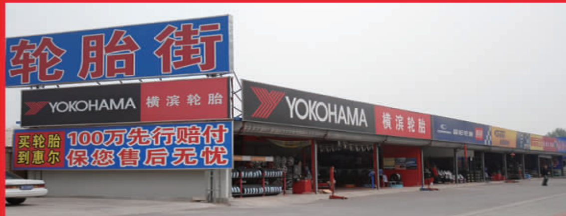
【西都轮胎街】地址:西四环四季青桥东500米路南 咨询电话:88500871

【轮胎街】从根本上解决了街边小店轮胎销售品种少、规模小、质量没有保证、服务跟不上的诸多销售弊端!【轮胎街】将为您提供更多、更广泛的选择空间!