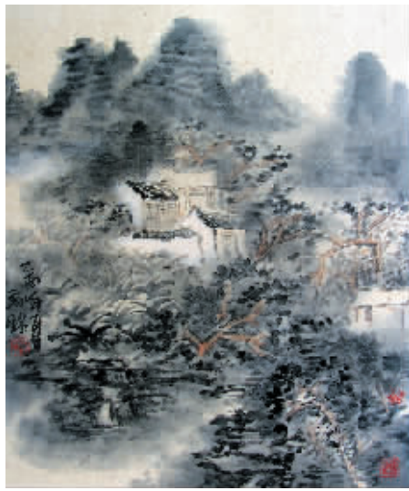
闫禹铭作品《秋居图》58cm x 38cm

艺术是一种有意味的形式。从技术层次到艺术层次逐步递进,达到艺术之境,赋予意味是每一个艺术家的终极追求。闫禹铭是渐入艺术佳境的画家。他的山水画家创作是有自己的笔墨语言和艺术形式的。正是这种艺术的形式语言构成了画家闫禹铭的山水画语境。