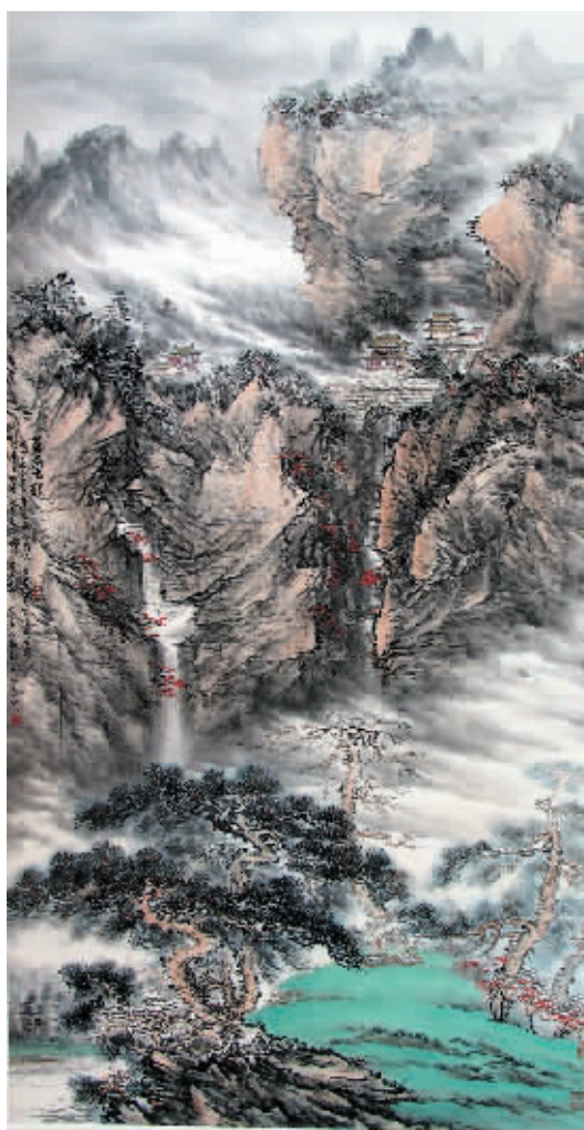
闫禹铭作品《苍岩古韵》178cm x 98cm