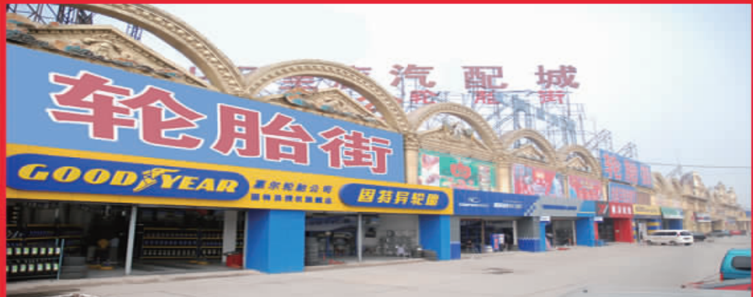
【东都轮胎街】地址:十八里店汽配城 咨询电话:67475327