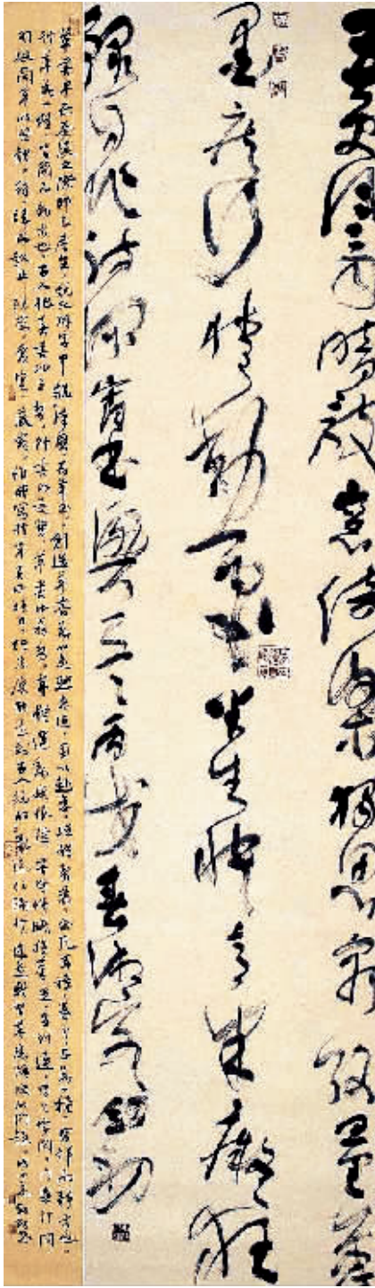
草书:五更风雨立轴

北京金谷满园广告有限公司开户许可证2008年6月5日不慎丢失,账号:01090372800120105118016,开户核准通知书号码为J100000121901,特此公告。2008年10月8日