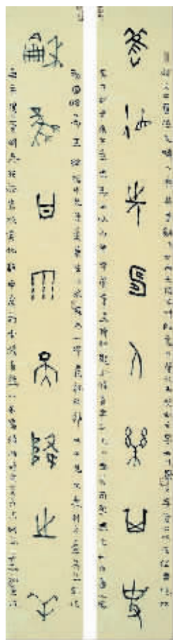
甲骨文:旧德和风联