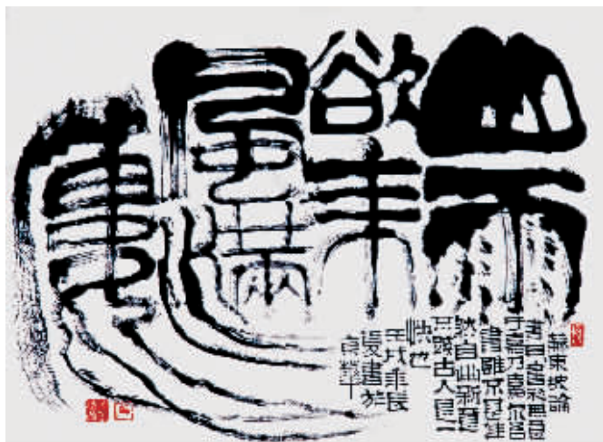
草篆:山雨欲来风满楼