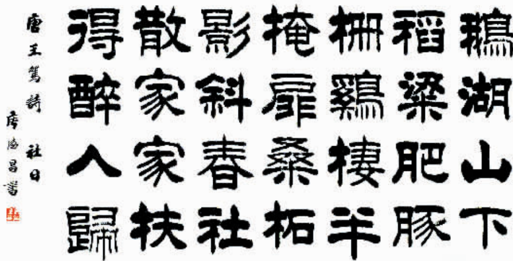
隶书:唐王驾诗《社日》