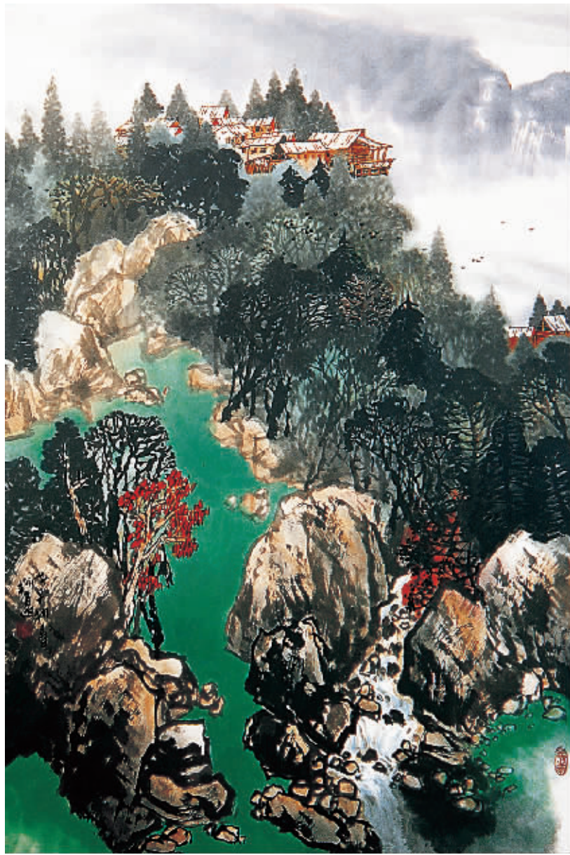
中国画·高山顶上的家园