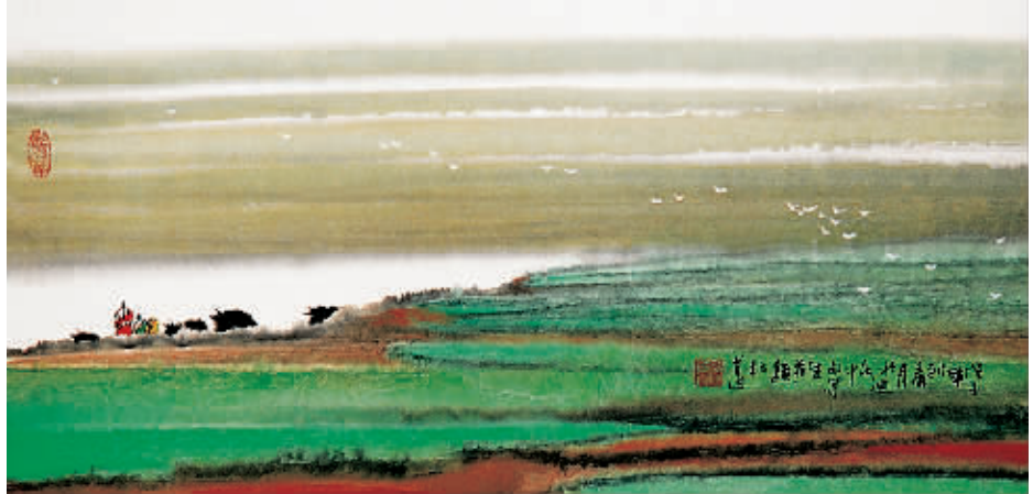
中国画·迪庆中甸草原