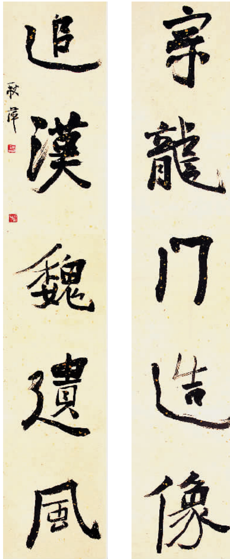
◎宗龙门追汉魏行楷对联

框来限制的，也很少能够对其所表现的线形和章法提前预知，能够安排的是汉字的基本字法和笔法，可以预知的是书写内容，无法设置安排和预知的则是它的线形在那一特定的瞬间舞动的生命形态所显现的墨韵效果，而这些在宣纸上生发出的水韵墨痕乃是个体生命状态和精神追求在那一瞬间真实偶然永恒的记录，也是书法家在那一特定创作时期对传统的理解、对艺术审美理想的追求和自我人格修养的全面展示及无言写照。各种思想无不打上时代的烙印，我们也无法割裂时代对艺术家物质的生命状态与精神铸造的影响。