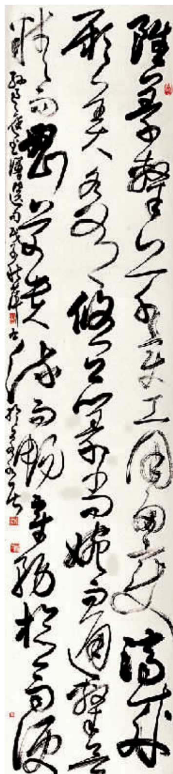
◎孙过庭谱句草书立轴

书法家在宣纸上创作时，凭借的是平时对书法理性的严格训练，而在宣纸上挥洒的一瞬间，只能是潜意识地控制毛笔运行速度和距离。手握毛笔，根据笔锋触纸的感觉不同来调整笔锋的距离，任心灵驰骋，任笔锋跃动，在笔锋尽情的飞舞中呈现毛笔滑行的速度，镌刻在宣纸上的是点画墨色的浓、淡、枯、润。不同的笔锋距离则表现规定动作提按、顿挫、使转的轻、重、缓、急、开、合、向、背，这些规定动作表现的细微差异形成了汉字不同的造型态势，不同的造型态势表现着书法家不同的智性、功力、性情和艺术修养及审美追求。