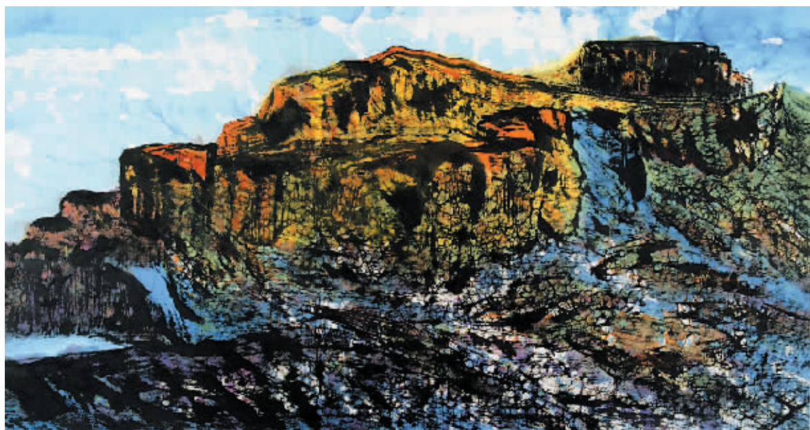
昆仑子作品《扎西德勒》