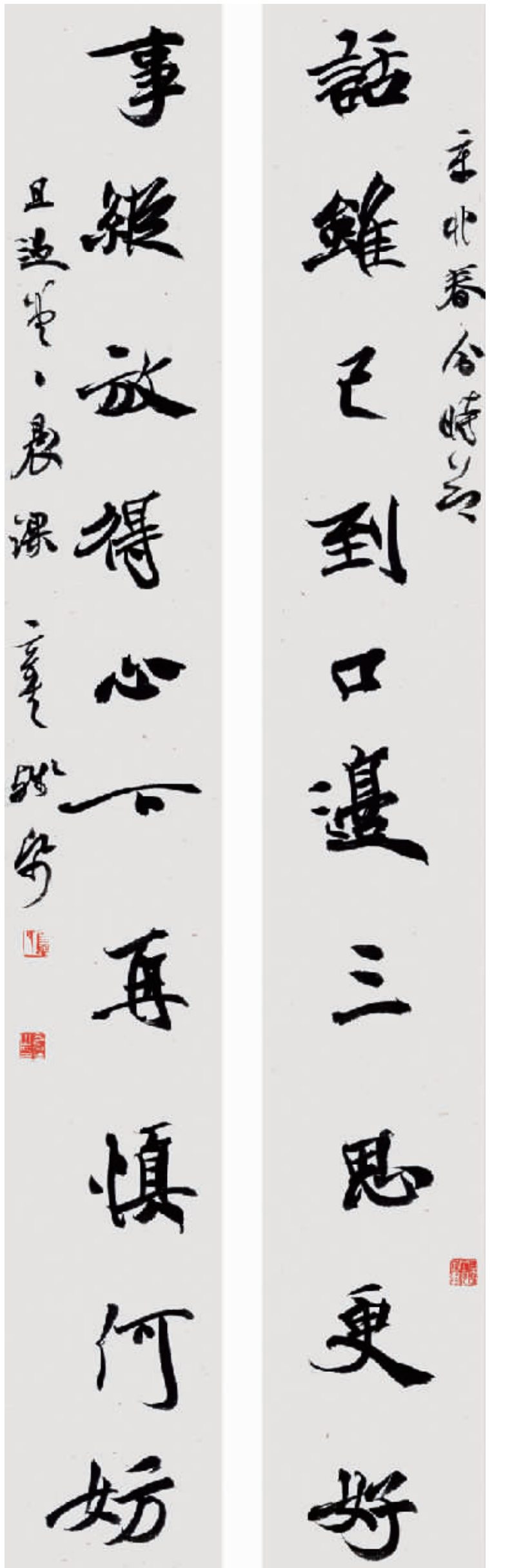
■书法·话虽事纵行楷书十言联