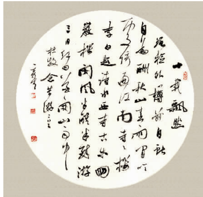
■书法·杜牧诗行书团扇