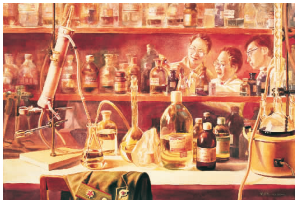
■ 水彩画·黄翠芬院士与她的学生

于是完成了《春雨潇潇》、《渔家春晓》等作品,同时心中筑成了水彩情节。而后便是对水彩艺术的苦苦追求。请名家辅导、临摹大师作品、进美术学院学习、利用部队有利条件深入和占有生活。曾与人一起赴青藏高原,登日月山,过沱沱河,翻唐古拉;也曾沿黄河逆流而上,在零下三十多度的严寒中,与当地人民同住,同放牧。丰富的生活积累,产生了创作水彩人物画的欲望,在人物作品中倾注着他热爱生活对大自然的热爱,随着作品的增多,也逐渐获得了力度。作品与作者本人也越来越为观众所熟悉。1991年他的第一幅水彩人物画创作《晴朗的日子》就是取材于唐古拉山,入选第二届全国