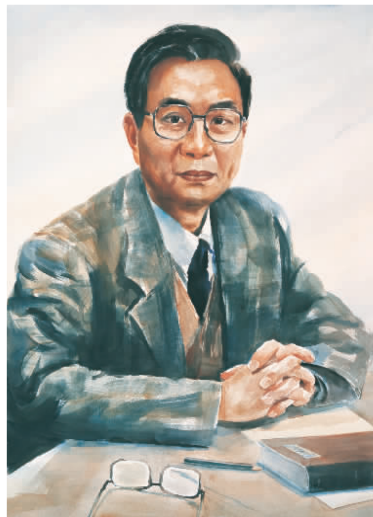
■ 水彩画·中国科学院吴祖泽院士

放军总后勤部驻天津一基层单位的宣传干事。因为我也曾是军人,所以互相投入了更多的一份热情。而后,一起走过了这十多年的水彩奋斗之路!在这十多年里,随着他年龄的增长、阅历的积累、学识的长进,他的水彩画也由稚嫩逐渐走向成熟。他的奋斗精神很让人感动。