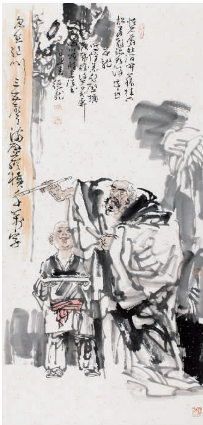
■ 国画·怀素书壁 136cm×68cm