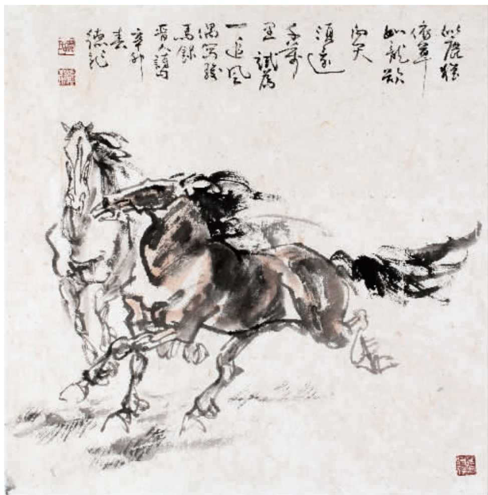
■ 国画·并驾追风 68cm×68cm

主任、教授、研究生导师,中国美协会员):乔先生的画,体现出他对中国传统文化的研究是相当深厚的。他的画基本上是用毛笔中锋来写的,而且非常有骨力。他的画很少有现在市场上的脂粉气,完全是画自己的追求。此外,他对文化名人的研究和描绘很到位,还引入一些民间的造型,因而他笔下的人物形象非常生动传神。