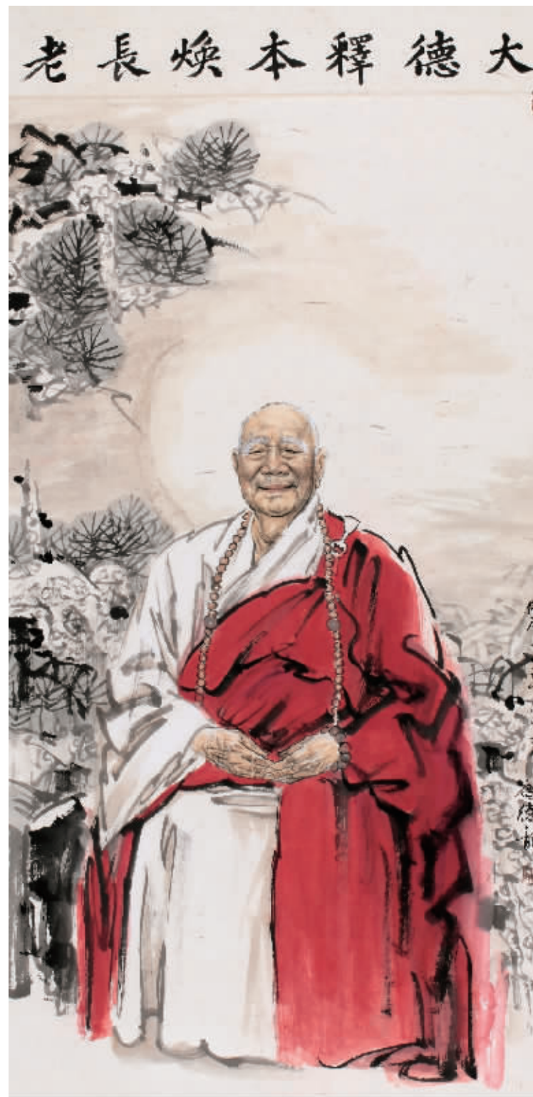
■ 国画·大德释本焕长老 136cm×68cm

钟浩天 (中国智慧工程研究会副会长): 乔老师非常用心对待每一副艺术作品,而且每副作品的构思与布局都很好,尤其是《大德释本焕长老》这幅作品,把本焕长老形神兼备、气宇轩昂的精神内涵画的活灵活现,其大德形象跃然纸上。