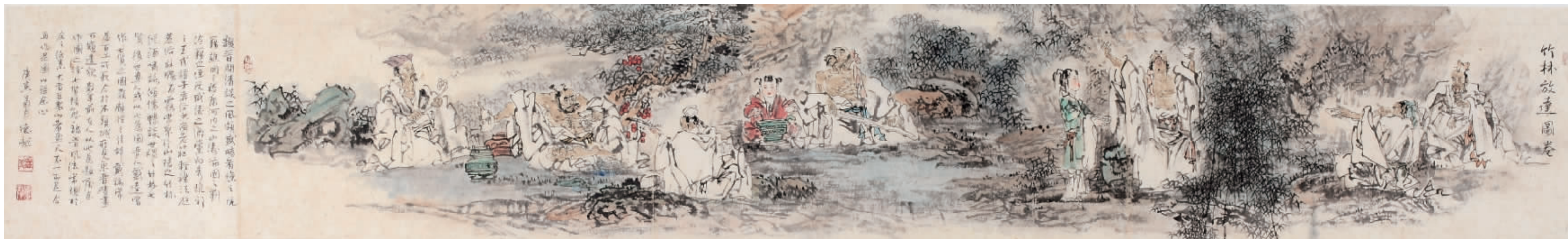
■ 国画·竹林放达图卷 35cm×272cm

的人生境界、儒雅的人格魅力,为当今浮躁的艺术圈注入了一股鲜活的艺术气息。他于书法、篆刻、古诗词与文学诸方面都有高深的造诣。