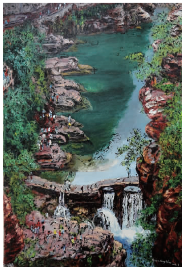
■ 油画·云台山印象之二 (80x60cm)

Tel: 8610-61769127 Mobile: 13910020189 E-mail: guanhongchen@263.net