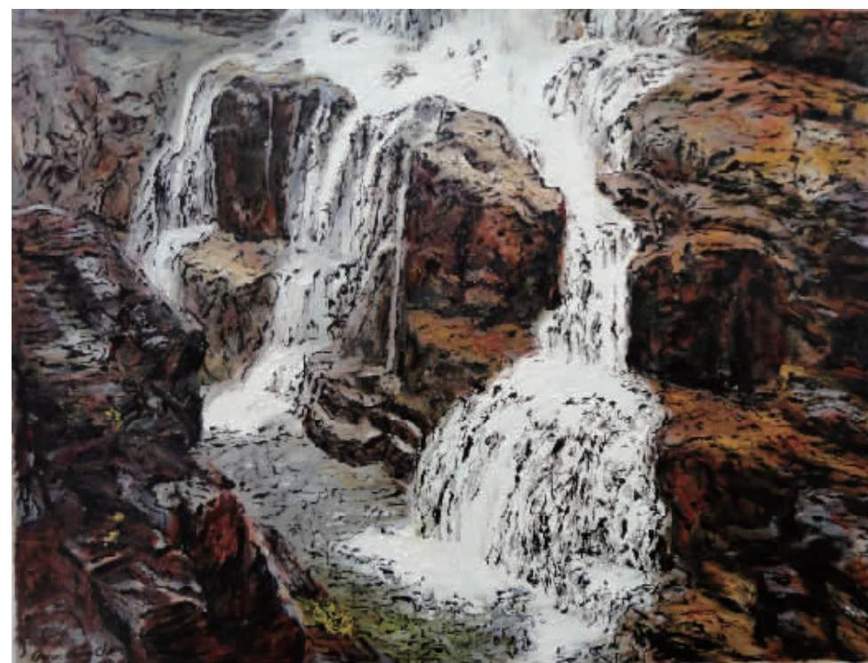
■ 油画·云台山印象之一 (80x60cm)

曾评价这个阶段的作品为“工作”,但从中可看到一个未来艺术家的执着,从他的工作作风中可感到他对事业、对他人、对亲人的真诚之心。经过中央美院的理论热身,他的作品实现了“质”的改变。我把他这阶段“质”的转变作品称之为“创作”。他系统的学习功力加上理论的武装,作品实现了突破,这里有着重考古学之风。顾恺之曾珍藏心爱古画一榻,米芾爱古书画几胜于生命,董其昌访求古画不遗余力,八大潜心临古,徐悲鸿、张大千几视古书画如命,毕加索、马蒂斯醉心于古代艺术。没有他们的学古就没有他们的成就。大师如此!画家关宏臣也是悟出其道而选择了学习学习再学习。进入二十一世纪后,画家关宏臣又以清华大学美术学院访问学者身份从师于当代著名画家杜大恺先生。从此至今所创作的作品具有了“大作”的风范。