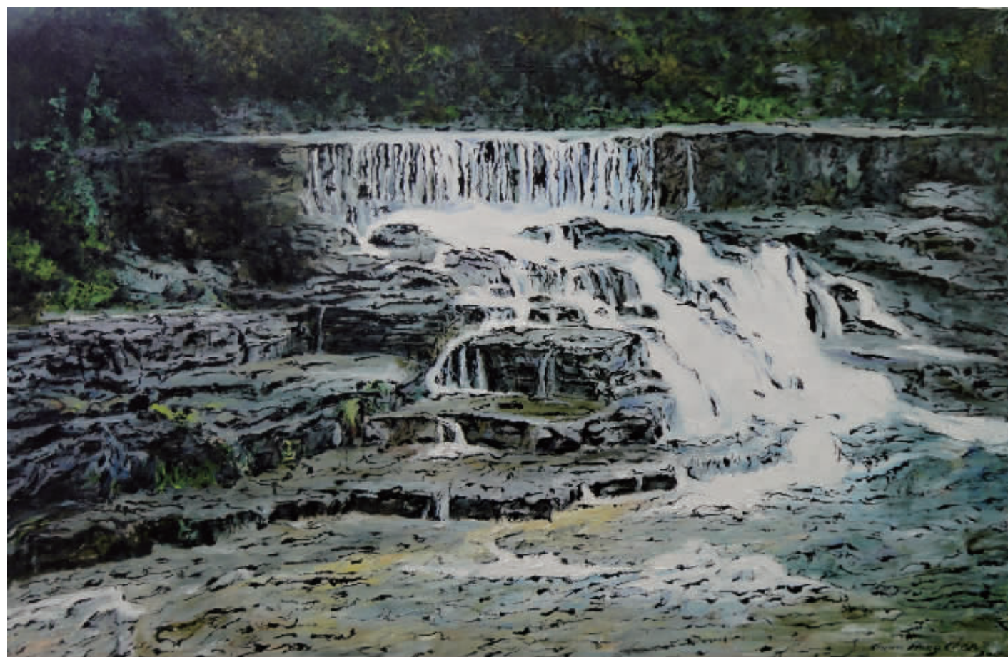
■ 油画·云台山印象之七 (100x65cm)