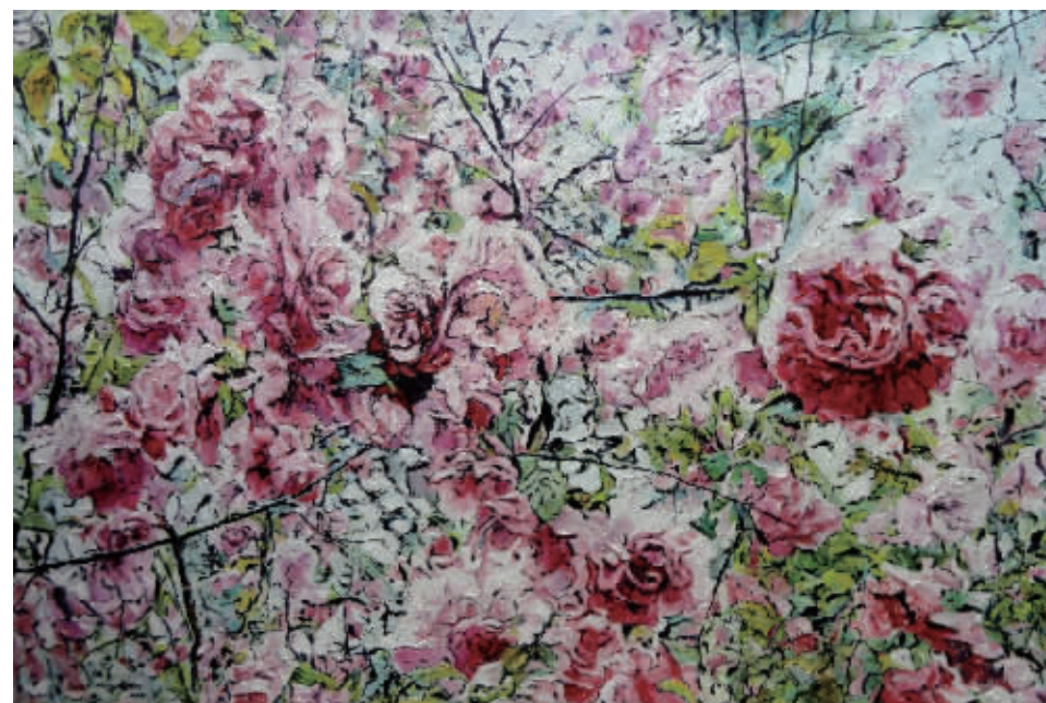
■ 油画·云台山印象之三十二 (100x65cm)

画家关宏臣的云台山风景油画系列作品,给人一种耳目一新之感。看似随意之笔却凝聚着画家多年不断探索的艰辛,以及为追寻一种属于画家自己所独有的风格样式所做出的不懈努力。通过画家的神来之笔将奇丽壮观的云台山呈现现在我们眼前:地质奇绝红石峡、猕猴谷、茱萸峰、青龙峡……等等。在这批作品中一个最为显著的特点就是学古创新为一体。没有他的创新就没有他的成