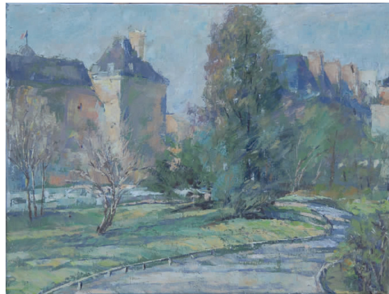
布面油彩 卢森堡公园(60cmx80cm)

在博物馆里, 你会遇见从幼儿园到大学的学生在这里上课。他们席地而坐, 认真的听着老师在讲课, 从小朋友专注的眼神里能听见老师绘声绘色的讲解; 在奥赛博物馆, 来自美术学院