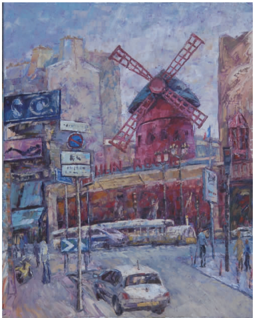
布面油彩 蒙马特红磨坊(100cmx80cm)