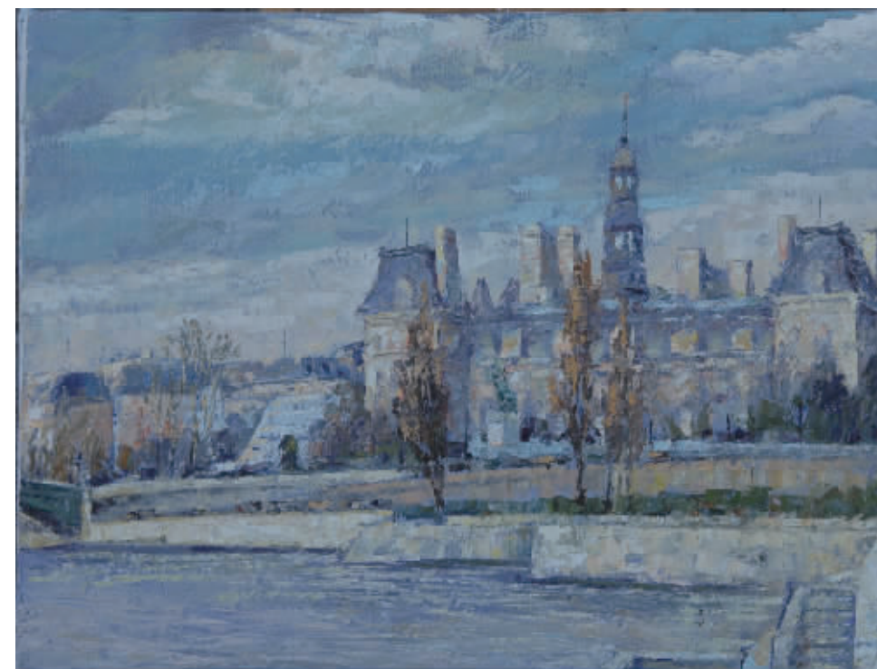
布面油彩 市政厅暮色(60cmx80cm)

临回国的最后一个夜晚, 我们走在塞纳河畔, 古老的桥上, 一位歌手弹着吉他, 唱着优美动人的歌。三三两两的行人, 静静的站在一旁, 痴痴的在听, 仿佛忘记了回家的路。天上的月亮, 亮亮的, 白云薄薄的在灰蓝色的天空缓缓的流动。我听不懂歌手的词, 但我能听懂他的心声, 歌曲的名字一定是——“爱在巴黎”。