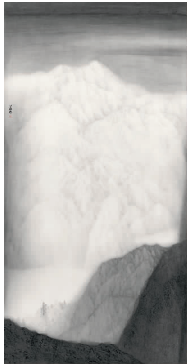
许华新国画 无欲 240cmx120cm

画的品质重新丰厚起来。他空寒晶莹的山水画凝聚了时间的包浆,聚合了多重的时间性。他的绘画既是时间的洁净化也是空间的晶体化:作画的时间性(一幅画的淡墨渲染要持续几个月),画家主体心性的时间性(对古意的体会与保持静如止水的淡然),画面对象的时间性(荒寒与空茫之境),材质的时间性(对宣纸与墨性的反复寻找与配搭)。在绘画中,许华新充分挖掘了水性的可能性,这是对水之自然潜能的发现,当水之柔软性发挥到极致,反而带来一种空白的空灵,这个形而上的空白带来了无形的厚度。此外,空白的聚