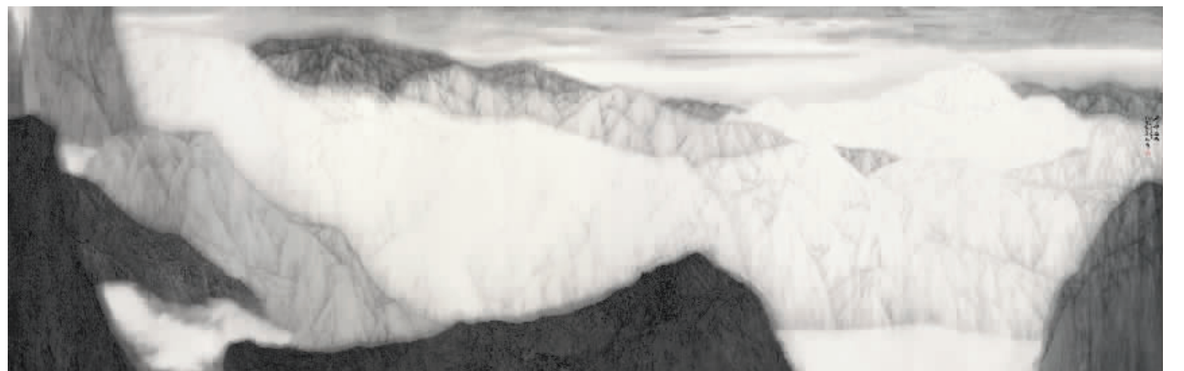
许华新国画 绝尘西去 270cmx800cm

许华新自觉以玉质感融入绘画,让山水之性与玉石之质内在地契合起来,解决了传统烟云之气与玉质之感在山水画上结合的难题,让柔软的水墨具有内在的硬度。面对西方艺术所带来的视觉冲击力,通过玉质感的融入,许华新以其“积水法”很好地完成了这个传统梦寐以求的生命质感彼此通感起来的艺术形式