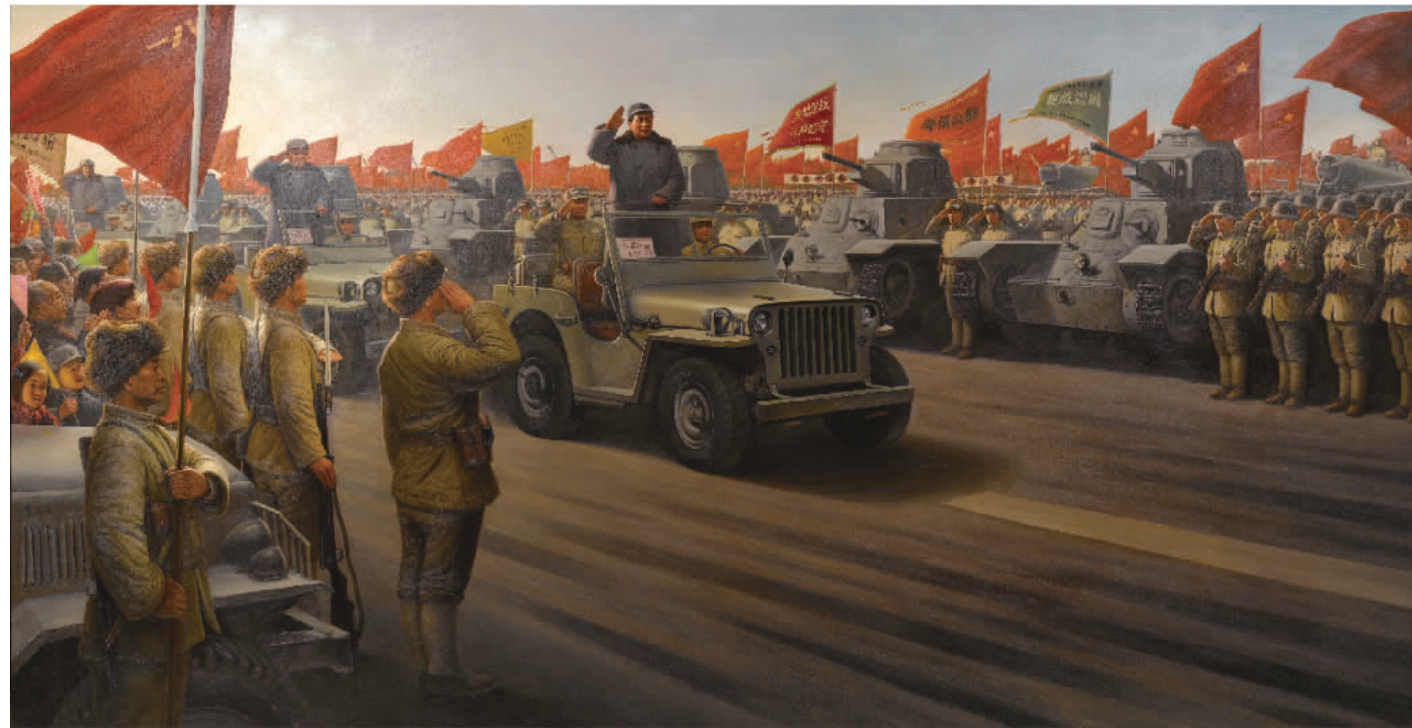
油画 毛主席西苑机场阅兵 500cmx260cm

2012年7月27日,在中国美术馆举办的庆祝中国人民解放军建军85周年全国美术作品展暨全军第十二届美术作品展览上,著名画家李长文创作的《毛主席西苑机场阅兵》获得展览最高奖——优秀作品奖。该作品宽5米,高2.6米,造型生动,形象鲜活,构思巧妙,场面宏大,气势磅礴,极具震撼力,引起了强烈的社会反响。