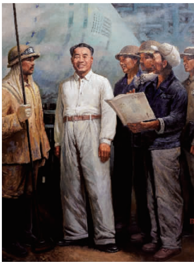
油画 朱总司令与水泥工人在一起 120cmx160cm

作品《天歌》《闪光的音符》《洗礼》《模拟飞行》《乳汁》《兵者》《天路》《生命礼赞》等入选第八届全国美展、第三届全国油画展、第十二届全国版展和庆祝中国人民解放军建军70周年、75周年、庆祝中华人民共和国成立50周年及抗洪、抗震救灾等全军美展,曾获全军美展三等奖,空军蓝天文艺特别奖,甘肃省美协一等奖等。大型军事题材油画《人民空军缔造》(合作)问世后,受到了美术界同仁及社会各界人士强烈反响。作品《毛主席西苑机场阅兵》入选“庆祝中国人民解放军建军85周年全国美术作品展暨第12届全军美术作品展”并获得优秀作品奖(仅设此奖)并被中国美术馆收藏。作品曾在中央电视台《书画园地》栏目《美术》杂志《美术报》《解放军报》等二十多家主流媒体发表。2011年应邀参加“纪念辛亥革命一百周年中国油画日本交流展”赴日本进行访问和学术交流。多幅作品被中国美术馆、纪念馆、部队军史馆和个人收藏。出版个人美术作品集多部。