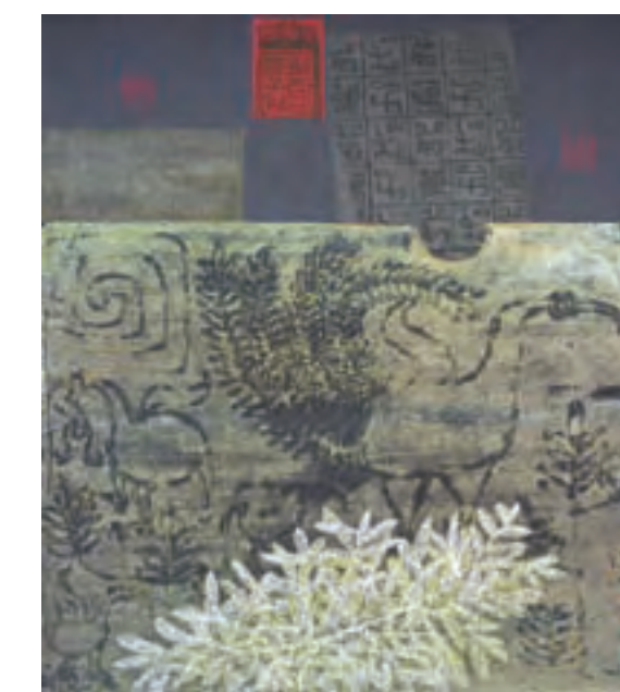
楚凤祥舞之一 96cm x 90cm