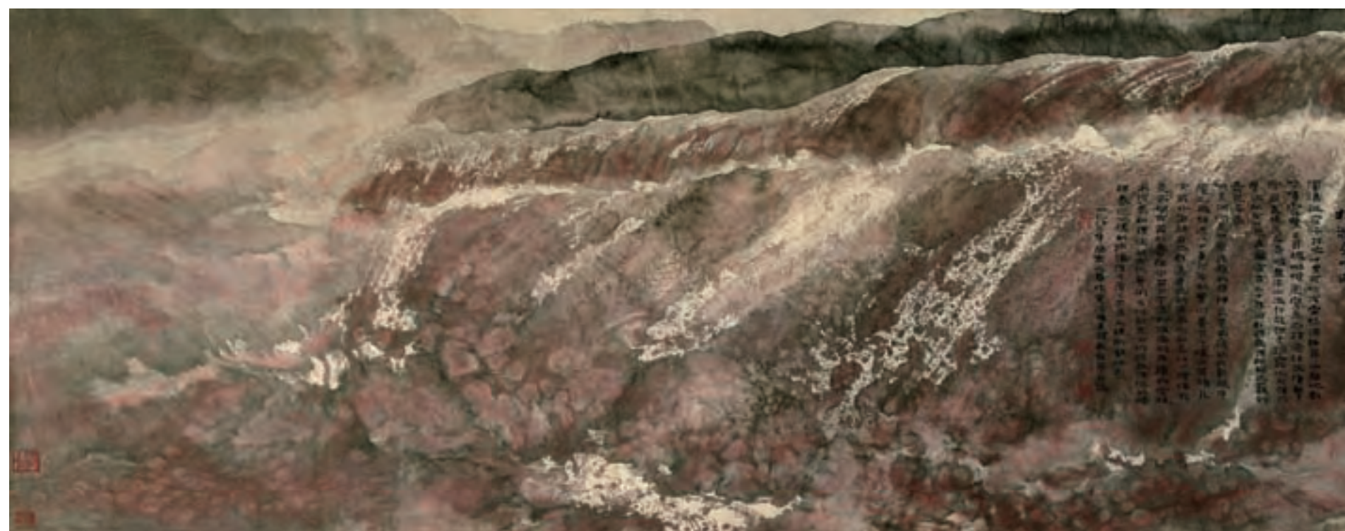
狂澜交响曲 125 x 248cm

周韶华的艺术志向是“抱一”，所谓抱一，是指一以治万、万物归一的总体论思想。老子《道德经》第二十二章：“圣