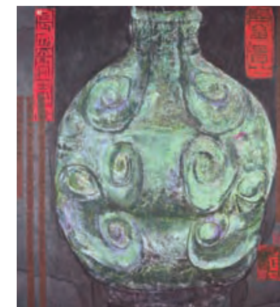
洪波 96cm x 90cm

周韶华的艺术风格，从构图到笔法都强调气势。《孟子·公孙丑》：“我善养吾浩然之气……塞于天地之间。”《淮南子·兵略》：“志厉青云，气如飘风，声如雷霆……此谓气势。”荆浩《笔法记》：“山水之象，气势相生。”气势是周韶华作品意象一贯的外表，它蕴含着崇高的理想主义和中华民族的浩然之气。