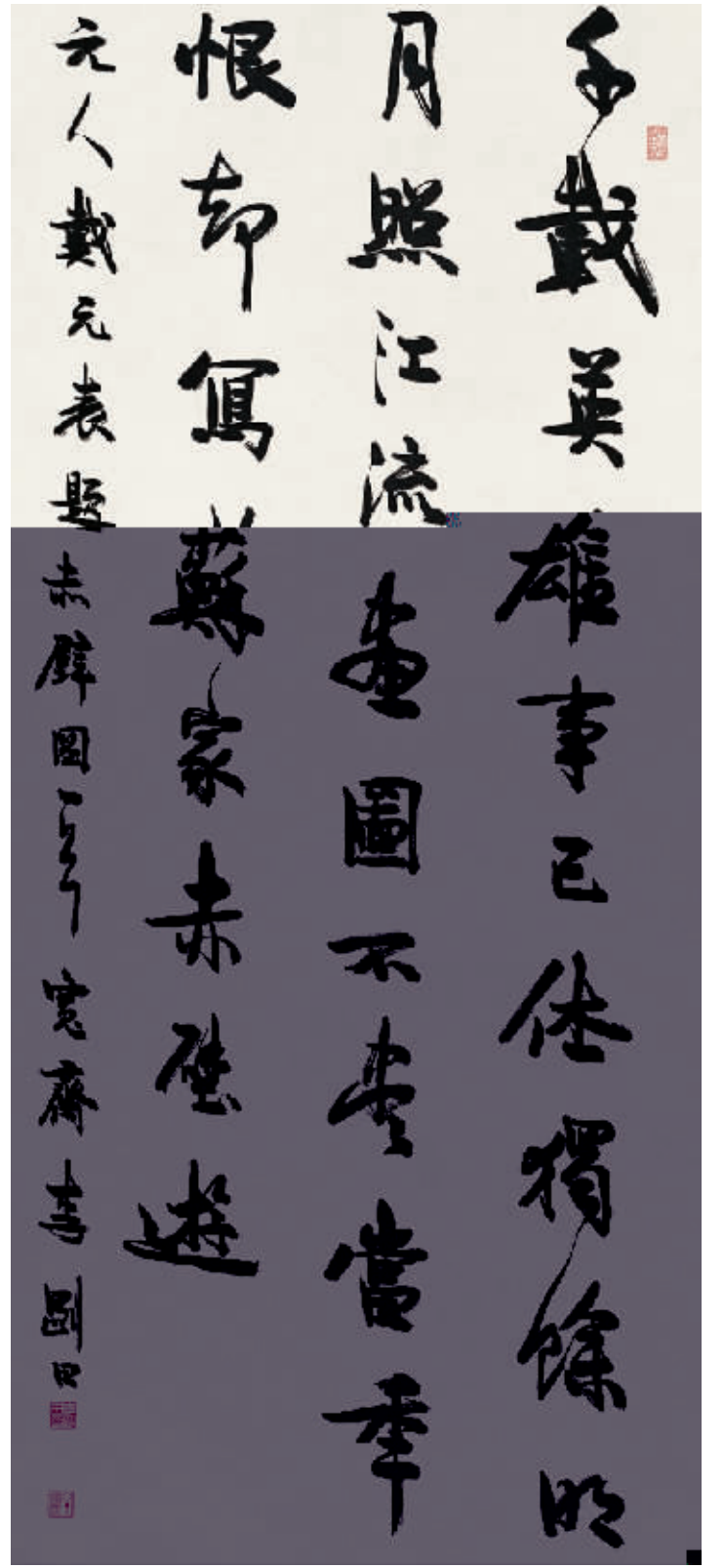
李刚田书法作品:行书中堂