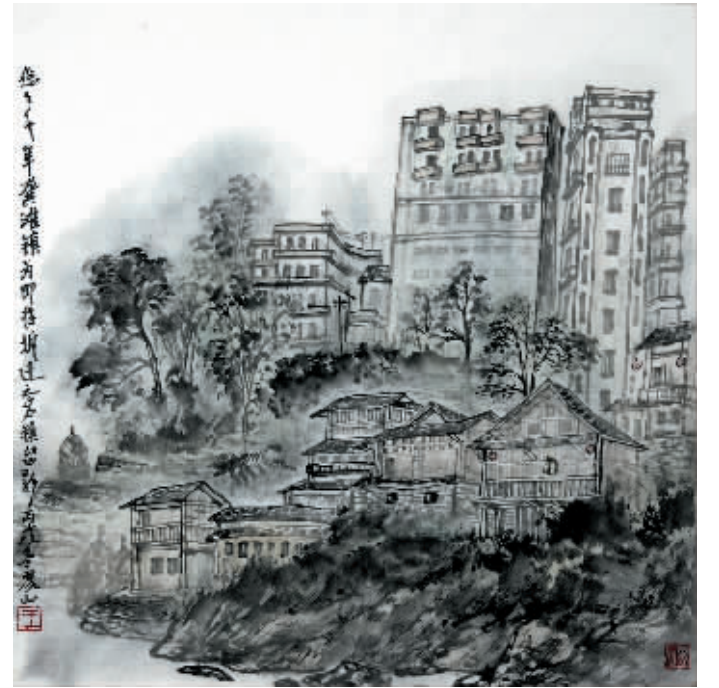
王界山作品《悠悠千年龚滩镇》50cmx50cm