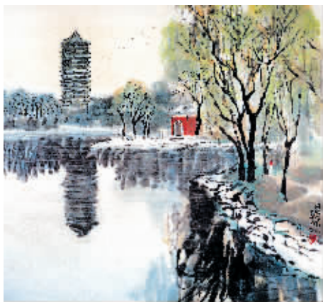
陈浩作品《湖光塔影》 65x68cm 1998年

本书作者结合自己多年的绘画实践,廓清和界定了“水墨都市绘画”的概念与内涵,梳理、回顾了近百年来中国城市风景水墨画的产生与发展,分析了这一新型画种与中国传统绘画以及现代西方绘画的关系,特别是“水墨都市绘画”的文化属性、艺术语言与美学特色,从而得出了充满信心与希望的结论与瞻望。