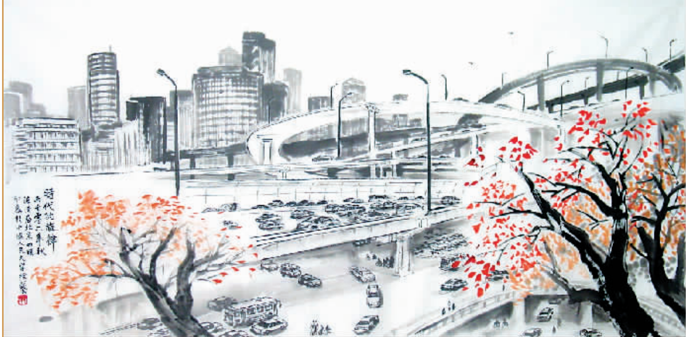
陈浩作品《时代的旋律》 68x136cm 2006年