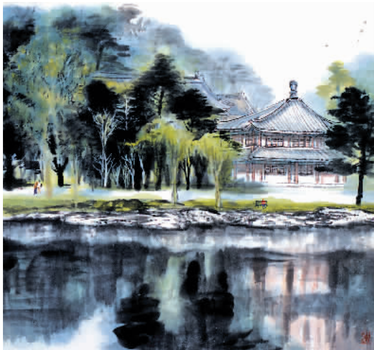
陈浩作品《体斋清晨》 65x56cm 1998年