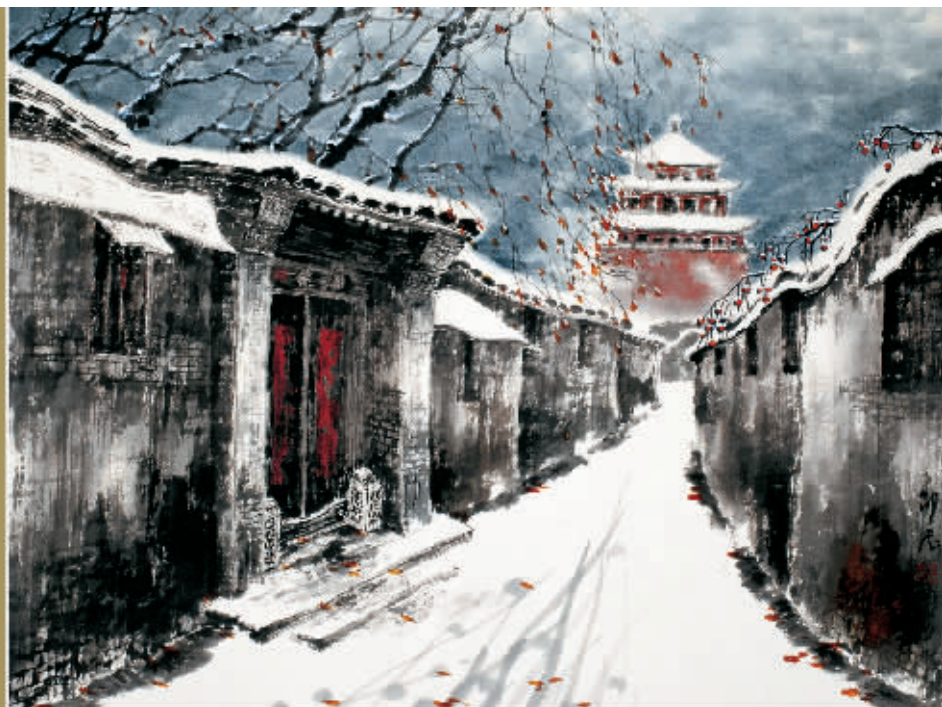
邵辰作品《钟楼晴雪》