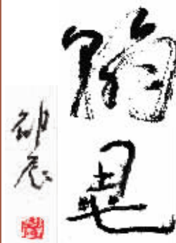
刊头题字 邵辰 金谷满园广告公司 协办 曙光电影院 第九十五期