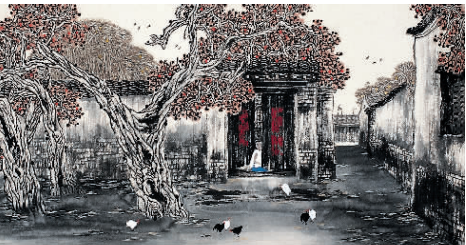
邵辰作品《儿时梦依稀》