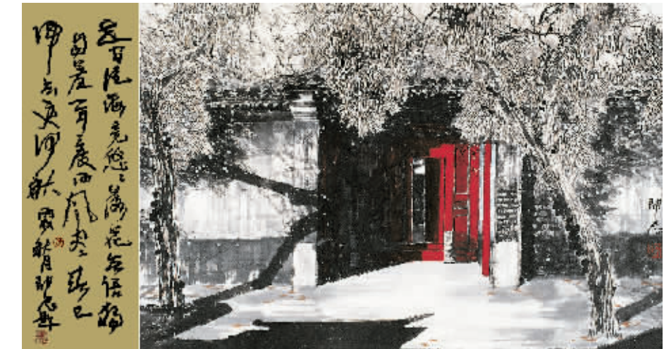
邵辰作品《岁月如歌》