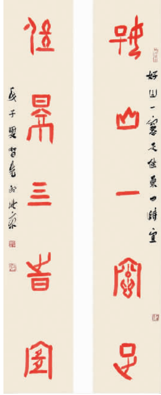
甲骨文对联 好山一窗足佳景 四时宜

干净而有力。灰色会减低力量感,弱化注意力,同时也会影响立体感,刘智先成功地平衡了这个两难性的选择。这样,由平面到立体的空间感就形成了,这个空间是简洁的、干净的、明亮的,充盈其中的是静雅的气息。这种既简洁又充实的永恒美,使刘智先的艺术别具价值。