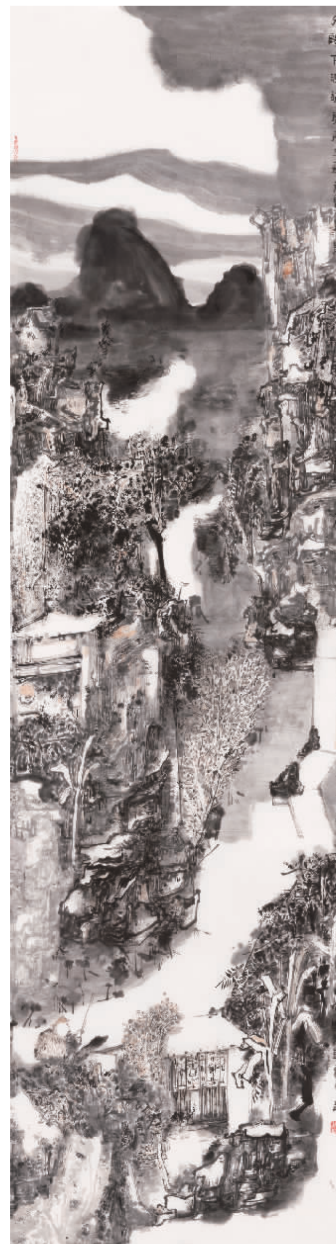
国画《元人诗意六条屏之一》180cmx59cm