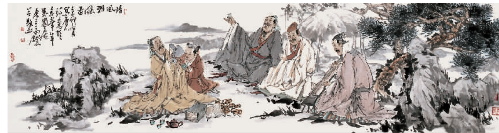
中国画·清风雅集图