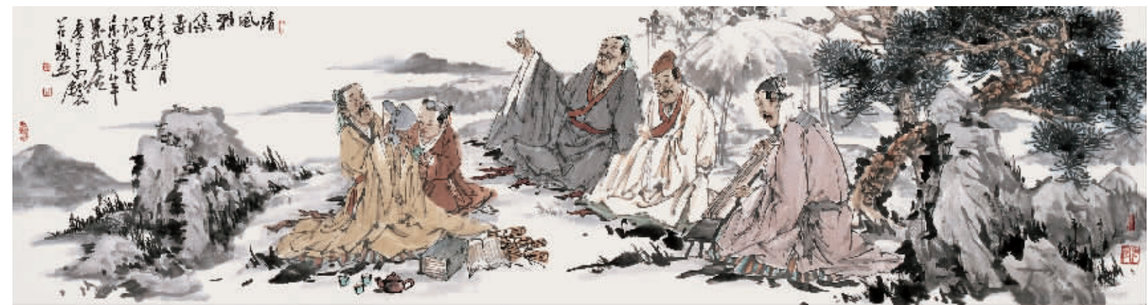
中国画·清风雅集图